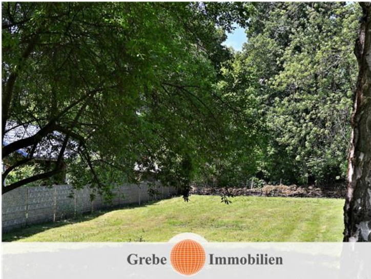
Blick über das Grundstück