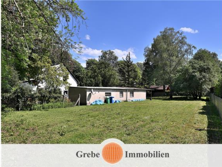
Platz für Ihr neues Haus