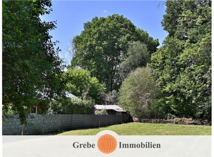
Grundstück mit 700 m 2